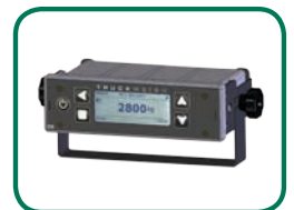
Montage am Armaturenbrett