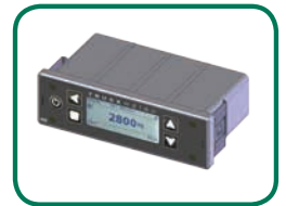
Montage im DIN-Radioschacht